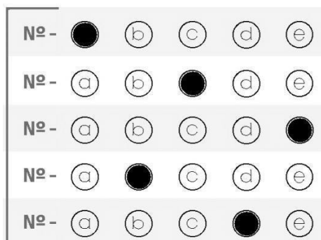
figura 02 - preenchimento CORRETO de cartão-resposta Ensino Médio